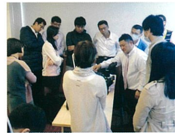
代理店様への製品説明会