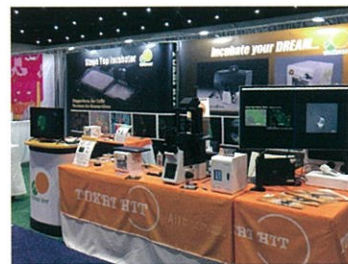
海外展示会での活動