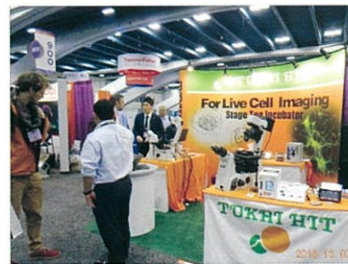
海外展示会での活動